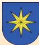
Benešov u Prahy